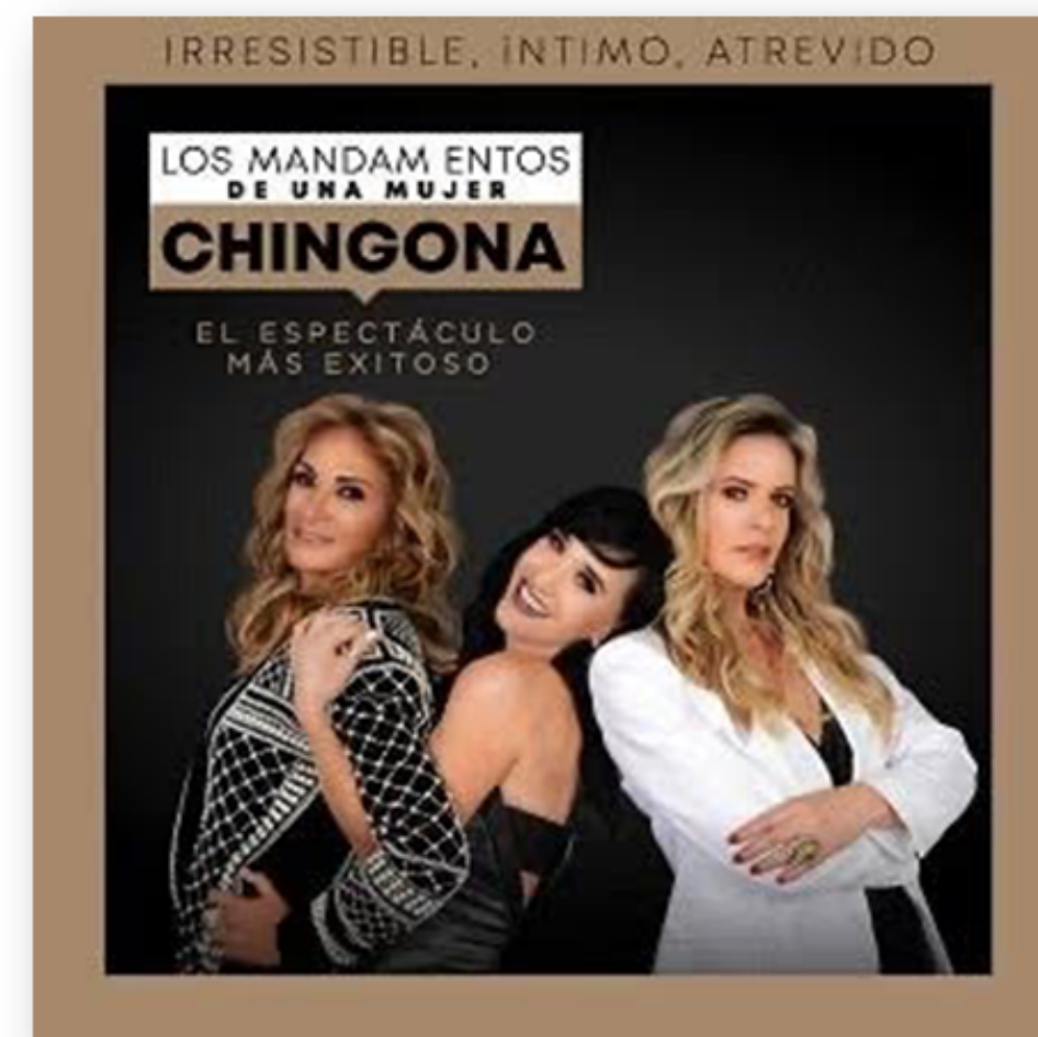
LOS MANDAMIENTOS DE UNA MUJER CHINGONA