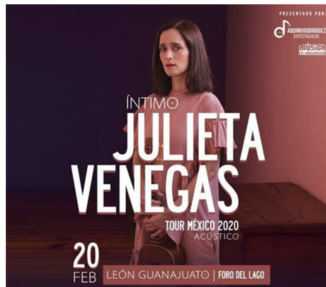
TOUR MÉXICO 2020 ACÚSTICO JULIETA VENEGAS